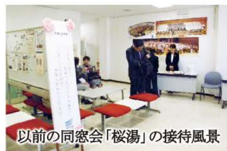
以前の同窓会「桜湯」の接待風景

以前は式典の後「学習センター」および「神奈川同窓会」共催にて「卒業・修了祝賀茶話会」を催し、ともに喜び合う機会を設けておりました。特に神奈川同窓会茶道部提供の「桜湯」は、皆様方から